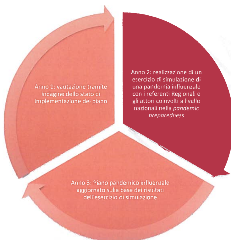
Figura 4 – Ciclo triennale di monitoraggio, valutazione e aggiornamento del piano pandemico influenzale 2021-2023