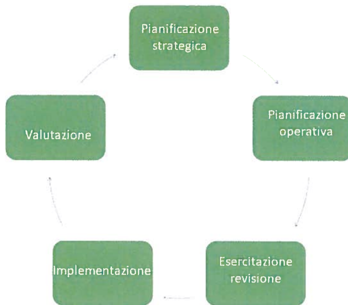
Figura 2 – Elementi chiave del ciclo di pianificazione pandemico

La preparedness alle pandemie è più efficace se si basa su principi generali che guidano la pianificazione della preparazione a qualsiasi minaccia per la salute pubblica. In particolare: