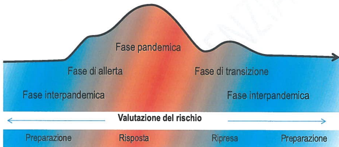
Figura 3 - Andamento delle fasi pandemiche

Queste fasi potrebbero evolvere in tempi differenti in un determinato Paese a seconda della conformazione geografica o di altre caratteristiche legate all'epidemiologia dell'agente eziologico. Pertanto, il diagramma sopra esposto potrebbe apparire diversamente rappresentato a seconda che si esamini una singola regione o l'intero Paese.